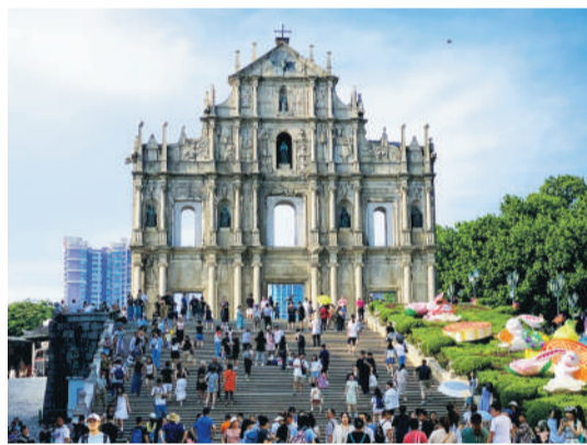
▲我們要繞過大三巴／那裏太擁擠，而我們／需要一點留白的空間。（資料圖片）