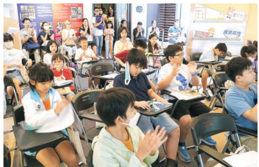
▲香港文學館「第一屆小作家培訓計劃」現場，坐滿了喜愛寫作的學生。坐在後排的是各學生的家長，獲特別安排一起上課。