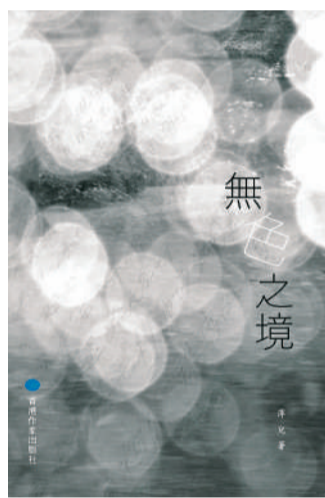
▲萍兒的新詩集《無色之境》。

這段詩句中，詩人以反覆的「放下」強調了情感的沉重與解脫。她的詩句如同輕柔的風，帶着淡淡的哀傷，讓人感受到一種深刻的孤獨感與思考的寧靜。